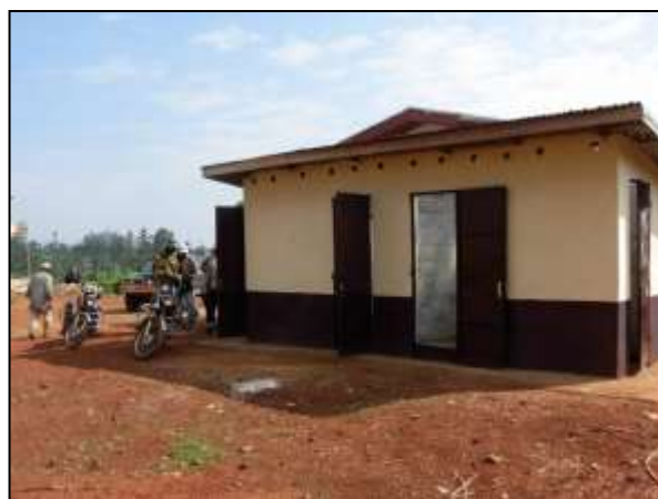
Les latrines écologiques