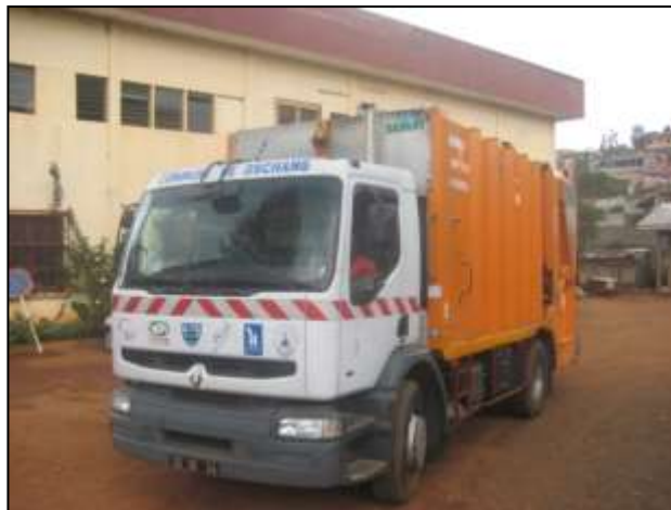
Collecte par camion

Le camion de collecte acquis d'occasion par l'association ELANS en fin d'année 2012, a été mis en circulation en février 2013. Il est utilisé par 2 équipes de 4 personnes (2 chauffeurs et 6 éboueurs) et collecte mensuellement environ 200 tonnes de déchets. Après une année de cogestion (maintenance, carburant etc.) du camion entre la ville de Dschang et l'association Tockem partenaire local du projet, le camion a été définitivement cédé à la ville de Dschang en décembre 2013.