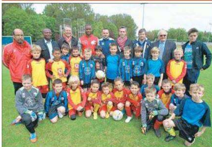
Photo souvenir pour les joueurs des deux équipes, Halluin en bleu et noir, Neuville-en-Ferrain en jaune et rouge. Au milieu des gamins, Aurélien Chedjou, défenseur central du LOSC, venu au stade Wancquet soutenir l'action de l'association Élans, au Cameroun.

► Le défenseur du LOSC était, hier, au stade Wancquet pour soutenir l'action au Cameroun de l'association halluinoise.