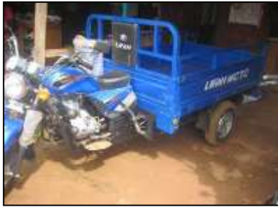
Moto tricycle acheté neuf