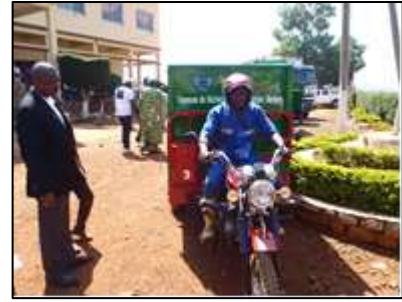
Présentation officielle à la mairie