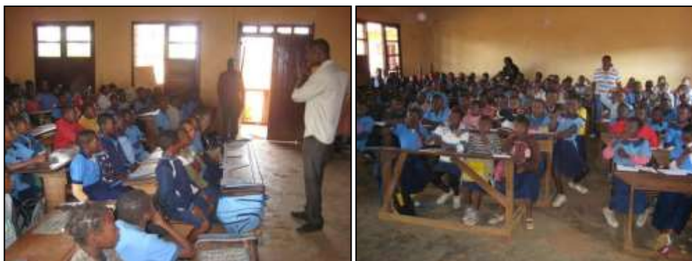
Séances de sensibilisation dans une salle de classe par les animateurs