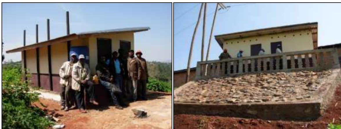
Latrines écologiques de Ndossah Gr 1 / Latrines écologiques de Ndossah Gr2