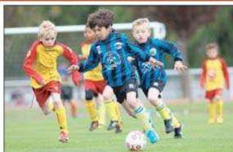
Sur la pelouse, il n'y a pas vraiment eu de match entre les U 9 de Neuville et ceux d'Halluin. Les locaux ont été battus 6 buts à 1 par leurs voisins.