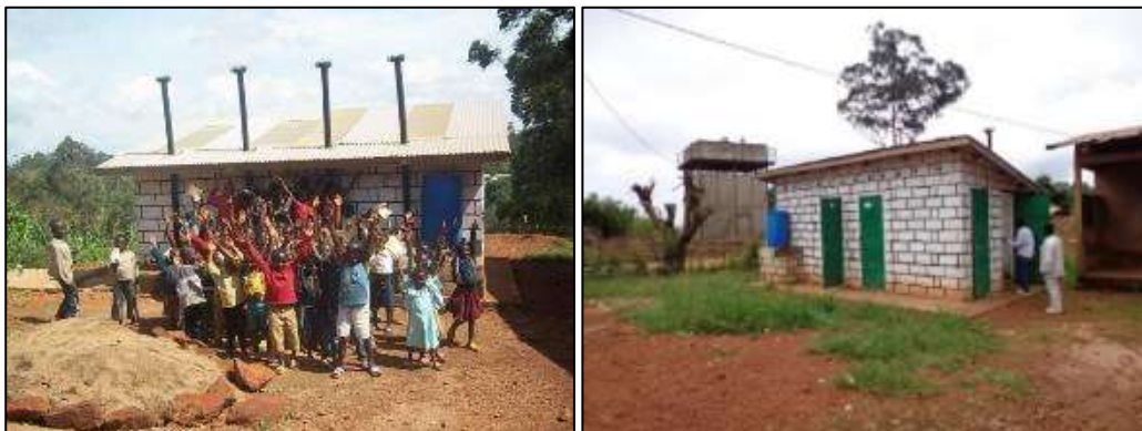
Latrines écologiques de Doumbouo (Mai 2013) / Réception définitive des latrines de Folewi Gr1 (Aout 2013)

La réception définitive des 3 blocs a été faite le 20 Aout 2013 soit un peu plus d'1 an après la réception provisoire des latrines. Cette réception a été effectuée en présence du GICAPBAF, de TOCKEM et d'ELANS.