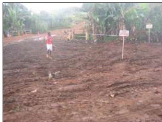
Après le nettoyage du dépôt