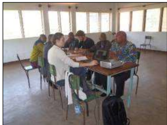
Membres du CoTech