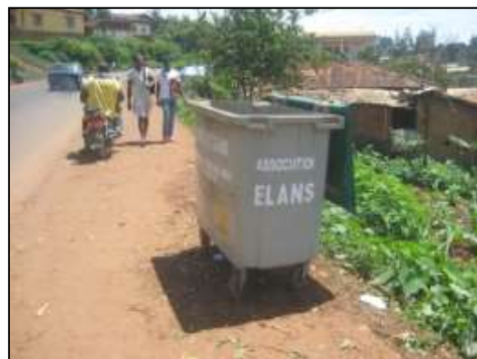
Bacs à ordures disposés à divers endroits de la ville