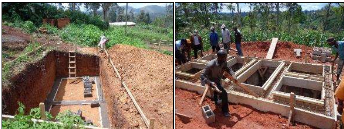
Fondation des latrines écologiques de Fokamezo Mentsah (Juin 2013) / Mise en place des coffrages avant coulage du béton des poutres de soutènements (EP de Fokamezo Dometsang, Juillet 2013)