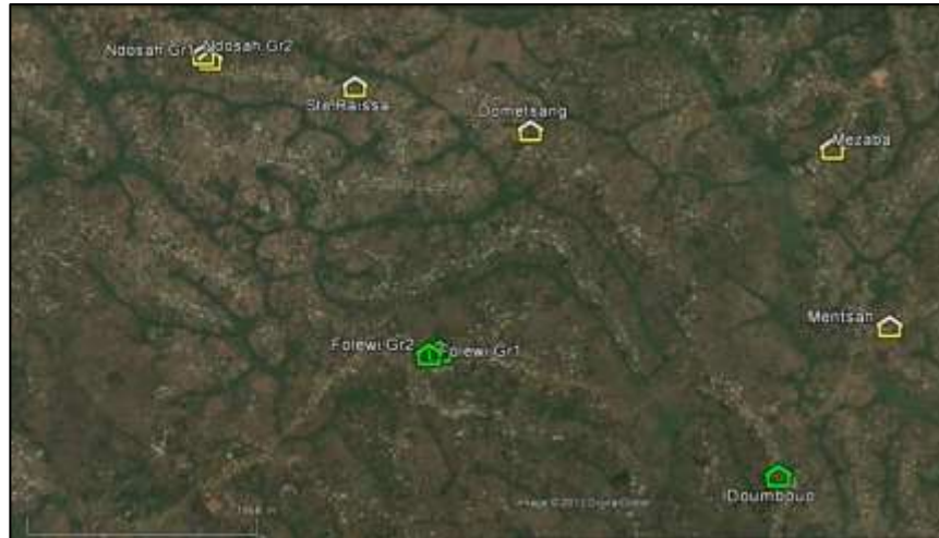
Localisation des latrines écologiques réalisées dans le cadre du projet de Bafou Sud (vert : 1 e phase / jaune : 2 e phase)