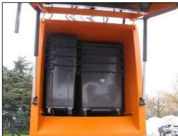
Le nouveau camion et les bacs de 770L prêts pour être embarqué au Cameroun