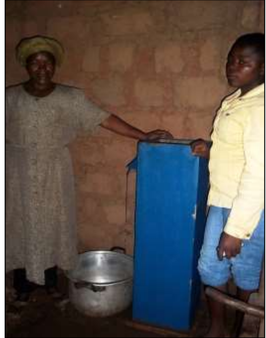
Filtres remis aux APC dans le cadre de l'amélioration de leur habitat