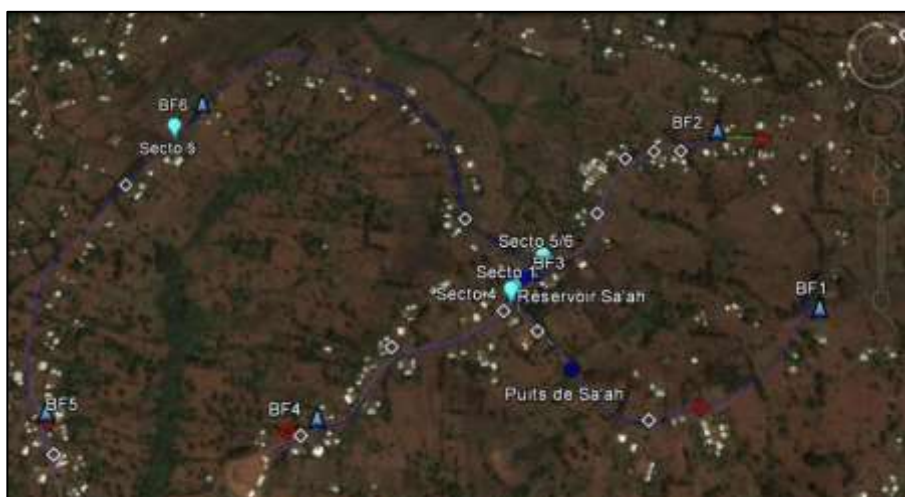
Localisation des compteurs de sectorisation et des Bornes fontaines sur le réseau de Sa'ah Batsingla

Le 9 Décembre 2013 a eu lieu la réception définitive des ouvrages en présence du VSI ELANS, du GICAPBAF et du maître d'œuvre sollicité en 2012 (entreprise NSEGBE).