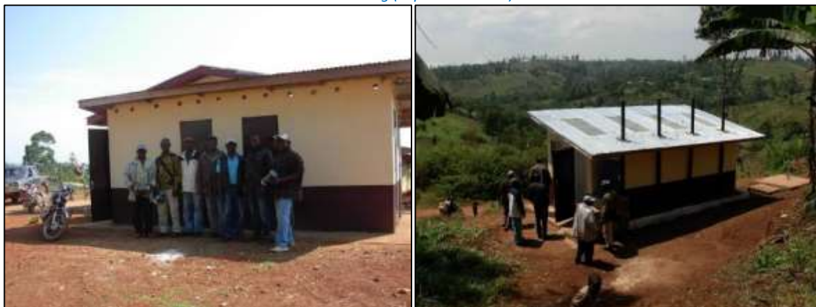
Latrines écologiques de Sainte-Raïssa / Latrines écologiques de Fokamezo Mentsah