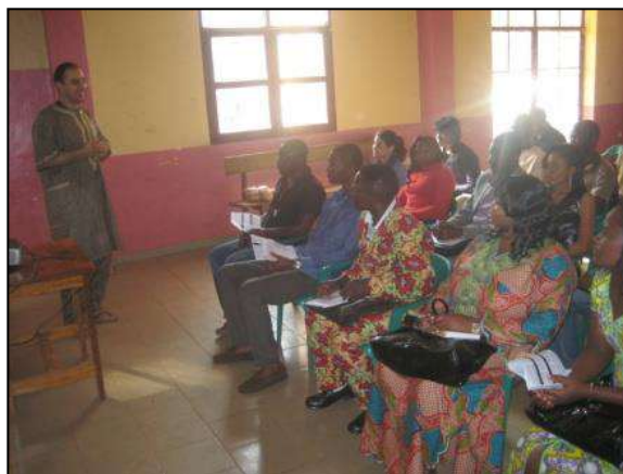
Séance de formation

suivantes : « L'importance des Agenda 21 locaux ou comment les collectivités locales et la société civile s'organisent contre le réchauffement climatique » et « De la ville à la campagne, écologie, sobriété et gestion des ressources locales »