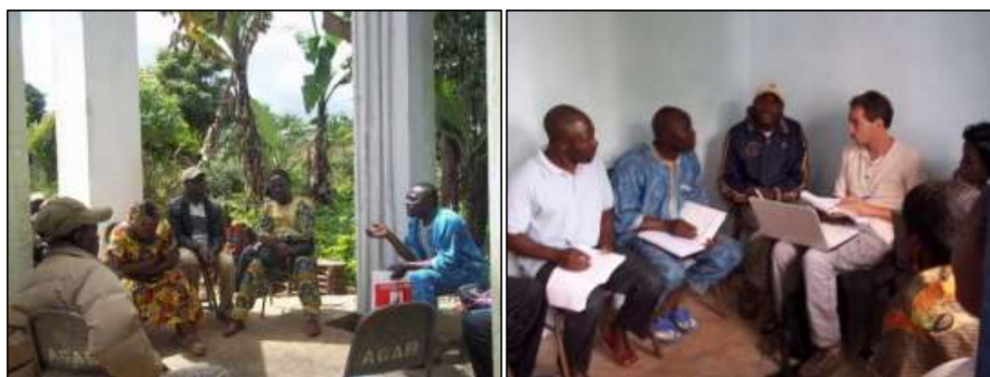
Assemblée Générale du 10/10/2013 / Participation aux réunions mensuelles du Comité de Gestion de Sa'ah