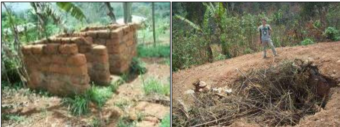
Latrines existantes des EP de Fokamezo Mentsah et de Folewi Gr1 avant les travaux (Mars 2013)

Un marché de prestation de travaux a été signé avec le GICAPBAF le 31 Mai 2013. Un expert en Génie civil provenant de la commune de Bangangté a été sollicité afin de s'assurer de la bonne exécution des ouvrages. Les travaux ont débuté le 31 Mai 2013 et réceptionnés provisoirement le 06 Novembre 2013 soit un peu plus de 5 mois après le démarrage des travaux. Les ouvrages ont été officiellement présentés aux populations et délégations le 12 Décembre 2013