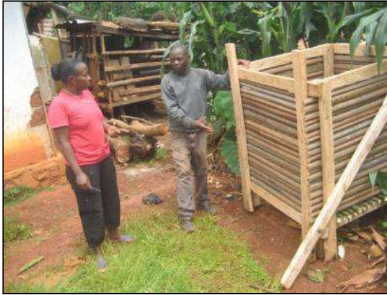
Explications du fabricant à la ménagère