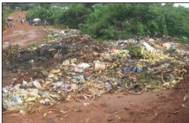
Dépôt anarchique avant le nettoyage