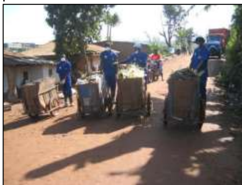
L'équipe de pré-collecte de Ngui

Afin de desservir les quartiers de la ville inaccessibles en camion, un système de pré-collecte est actuellement expérimenté dans le secteur de Ngui. L'équipe est composée de 4 pré-collecteurs avec un porte-tout chacun. La quantité de déchets collectée mensuellement est en moyenne de 40 tonnes. Ces déchets sont déposés sur le site de compostage d'ERA-Cameroun où ils sont traités et transformés en compost.