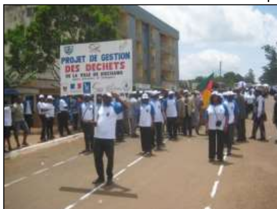
Equipe du projet participant au défilé du 1er mai 2013