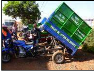
Motos tricyles renforcées