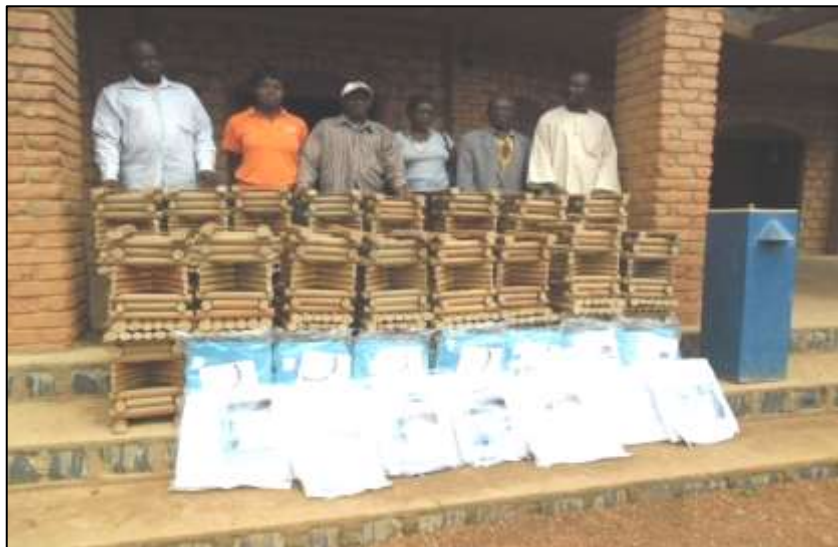
Matériels distribués aux APC pour l'amélioration de leurs habitats

Au titre des satisfactions, il faut noter que 5 APC ont acquis leur autonomie financière.