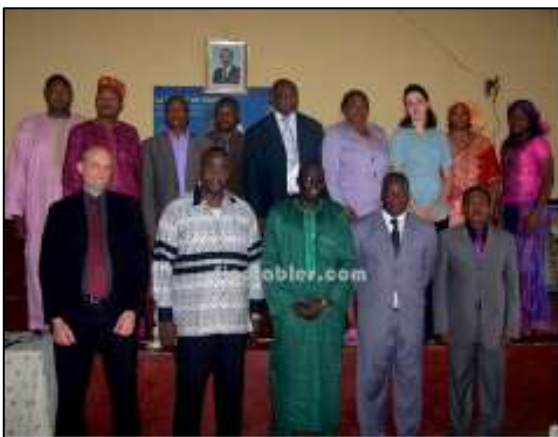
Membres du CoPil

En parallèle, un Comité Technique (CoTech), regroupant l'ensemble des techniciens œuvrant dans la gestion des déchets de la ville, tient des réunions d'exploitation une à deux fois par mois. Ces réunions sont l'occasion de gérer le quotidien mais également de soumettre des propositions au CoPil pour l'avancement du projet dans son ensemble.