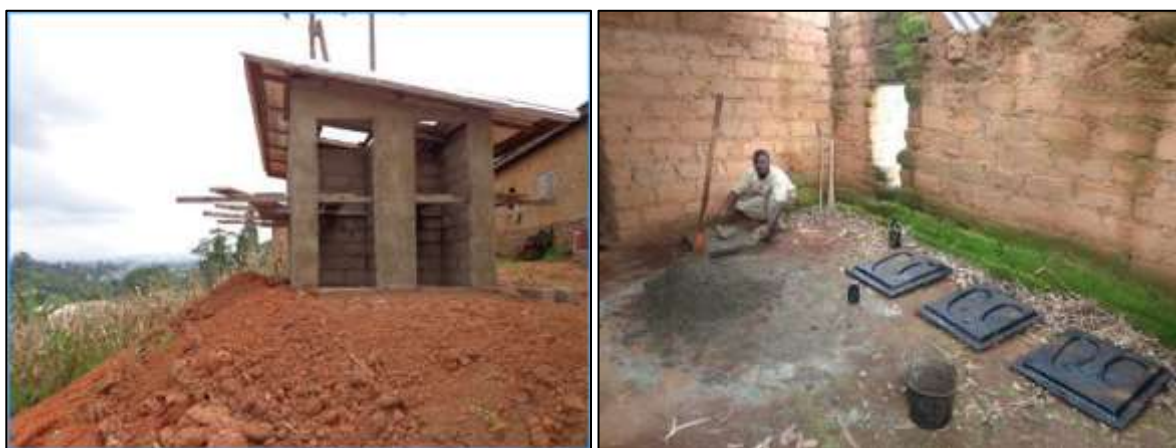
Phase de montage de la superstructure, EP de Ndosah Gr1(Août 2013) / Réalisation manuelle des sièges, EP de Fokamezo Dometsang (Septembre 2013)