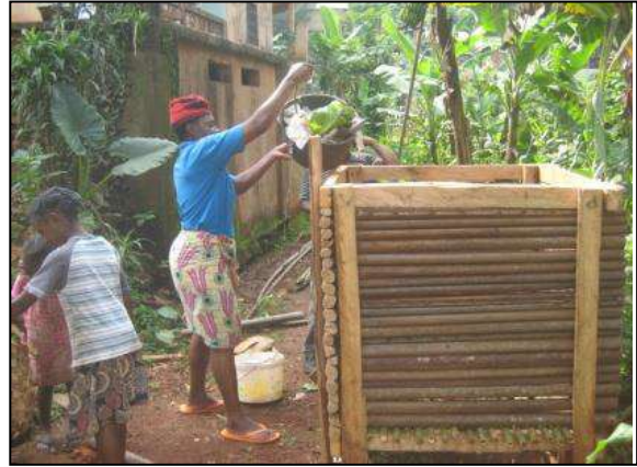
Dépôt de déchets