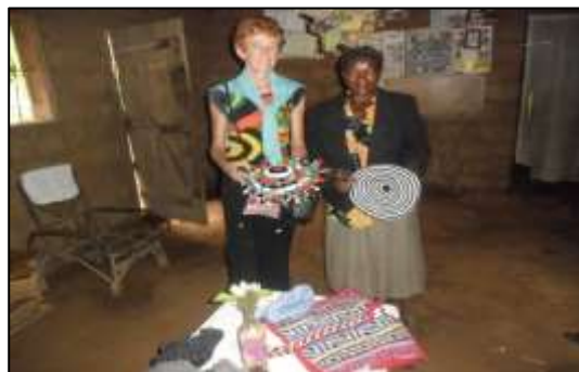
Visite des projets boulangerie (à gauche) et tricotage (à droite)